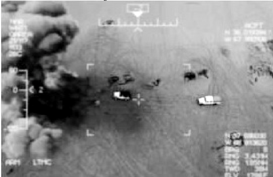
Bild aus NATIONAL BIRD, Dokumentarfilm von Sonia Keenebeck, Wim Wrenders & Errol Morris

Seit 2016 ist die Drohne Heron I ununterbrochen im Krieg in Mali eingesetzt. Auch hier liefert sie in „Echtzeit“ Bilder und Videos, die über die Satellitenempfangsstation Gelsdorf mit schneller Datenleitung nach Jagel geschickt werden. An diesem Standort beschäftigen sich die Soldatinnen und Soldaten rund um die Uhr mit der Auswertung dieser Bilder. Ihre Aufgabe besteht darin, sich Bilder mit Kriegshandlungen anzusehen: zerstörte Häuser, verletzte und getötete Menschen. Diese Bilder sind real, sie sind zeitgleich aufgenommen worden, um in Echtzeit zur Auswertung zu kommen. In Jagel werden die Drohrendaten in verwertbare Bilder übersetzt, zusammen mit anderen Informationen werden daraus neue Kriegspläne entwickelt. Dann sehen die Bildauswertenden in Echtzeit weitere zerstörte Häuser, verletzte und getötete Menschen.