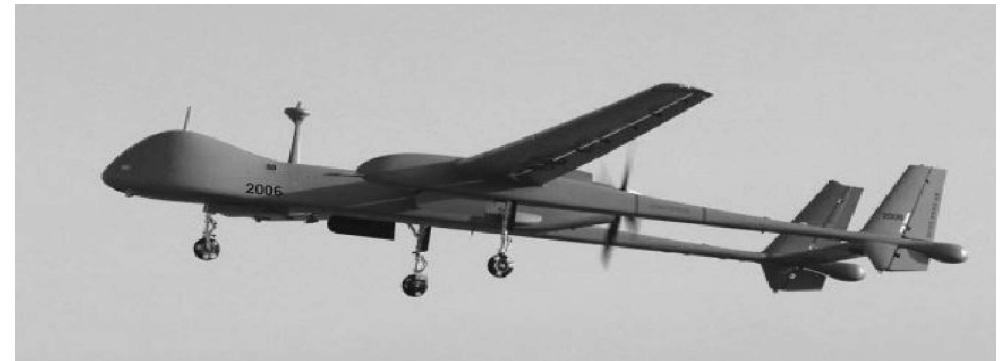
Bild: Drohne Heron TP

Die bewaffnete Kampfdrohne Heron TP soll ab 2019 der Bundeswehr zur Verfügung stehen. Ihr Einsatz wird vom Drohnenstandort Jagel aus organisiert.