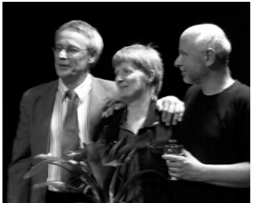
Fraktion der Linken