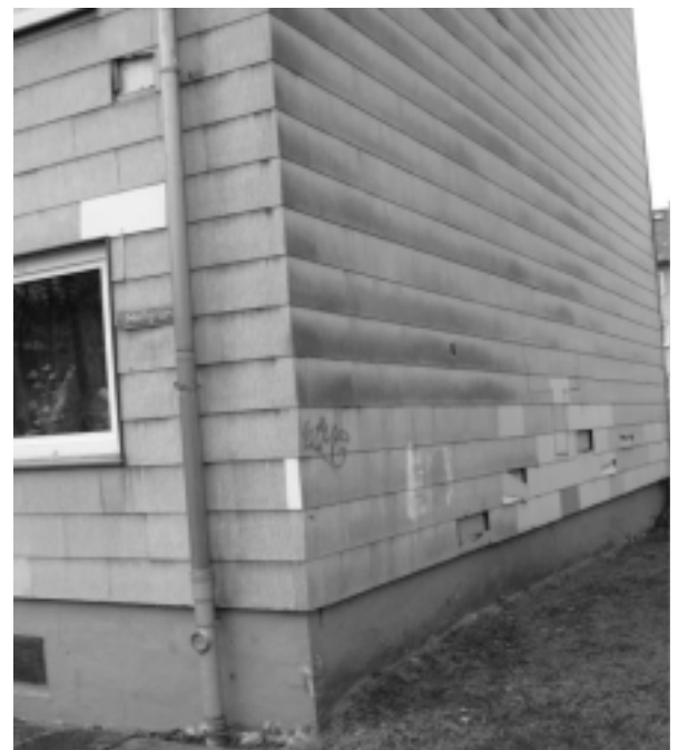
Hellgrund - Häuser: Der „Lack“ ist ab, die Fassade bröckelt, auch die von Kaputtbesitzer „Nimm“.